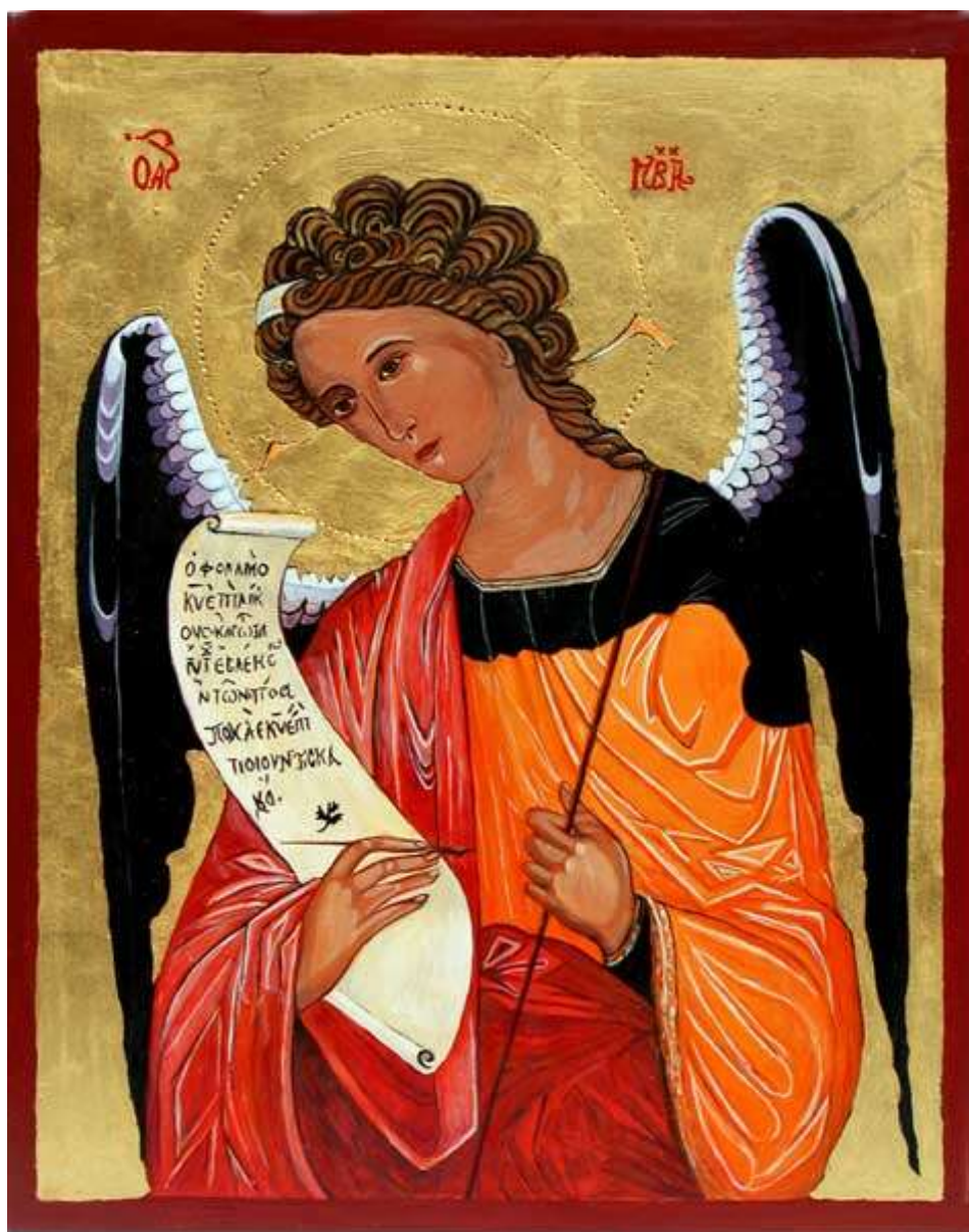
Ærkeenglen Gabriel. Ikon skrevet af Kirsten Hansson Brøns

Syv onsdage kl. 14.30 i Sognegården Sæson 2011/2012