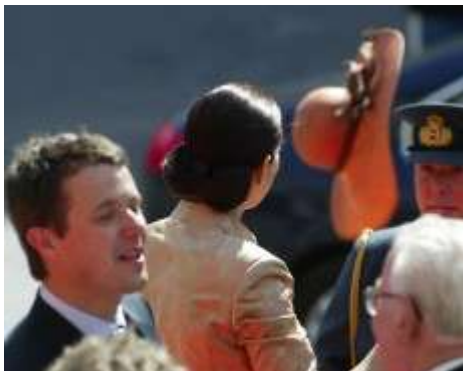
Kronprinsse Marys hat blæser af onsdag den 13. maj, 2004, Christiansborgs Rigsdagsgård.