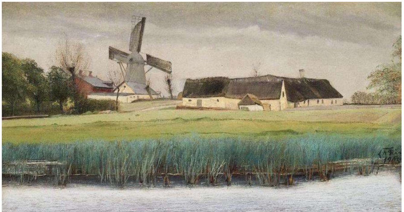
L.A. Ring: Stråtækt gård og mølle ved sivomkranset sø, 1905

L.A. Ring blev døbt Laurits Andersen, men tog senere i livet tilnavnet Ring efter sin fødeby Ring ved Næstved. Vi skal i dette foredrag se og høre om nogle af L.A. Rings malerier fra den periode, hvor han boede i Baldersbrønde ved Hedehusene. Men vi skal også høre om nogle af hovedværkerne fra tiden op til denne periode.